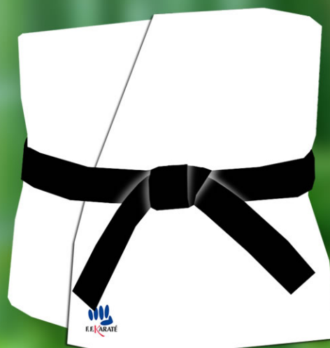
6 - Les deux bouts doivent être de même longueur et le noeud le plus le plus carré possible