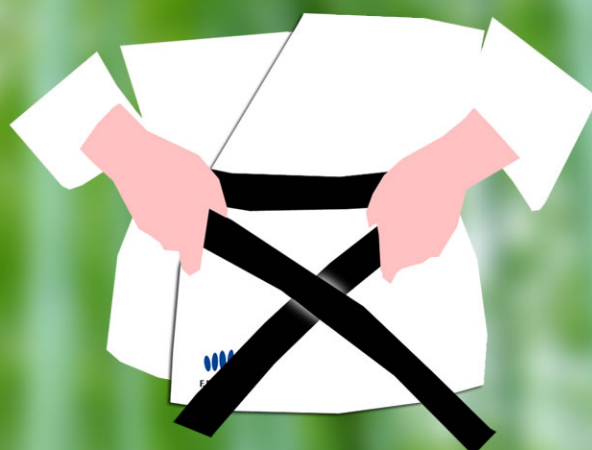
2 - Passez-la derrière vous et ramenez-la au devant, la ceinture de la main droite est au-dessus