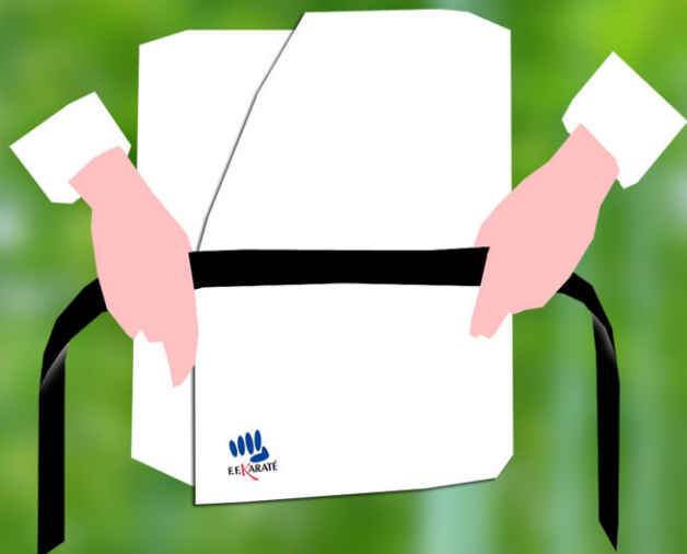
1 - Tenez la ceinture devant vous