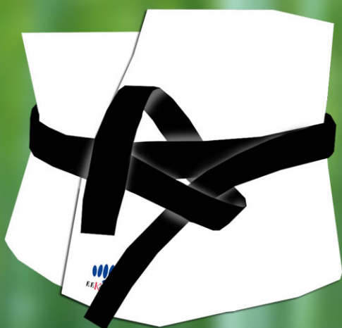
3 - Faites un premier noeud